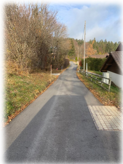
Chemin de Lally

Cette année, nous avons réalisé la réfection du :